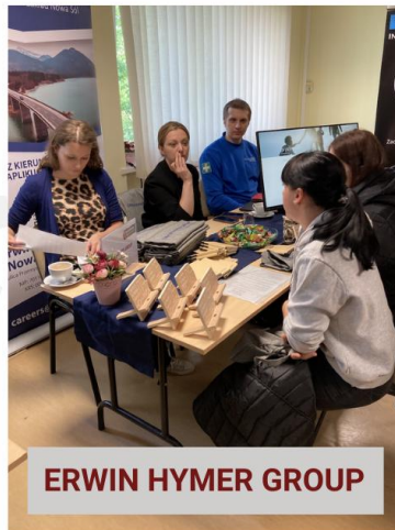
ERWIN HYMER GROUP