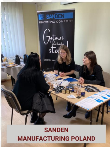
SANDEN MANUFACTURING POLAND